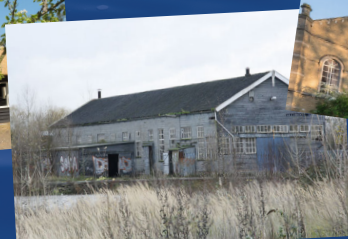
Scheepswerf van Duijvendijk