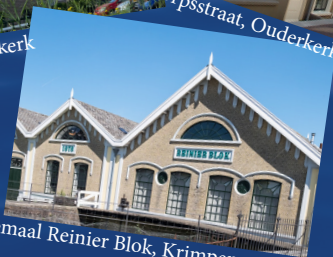
Gemeaal Reinier Blok, Krimpen